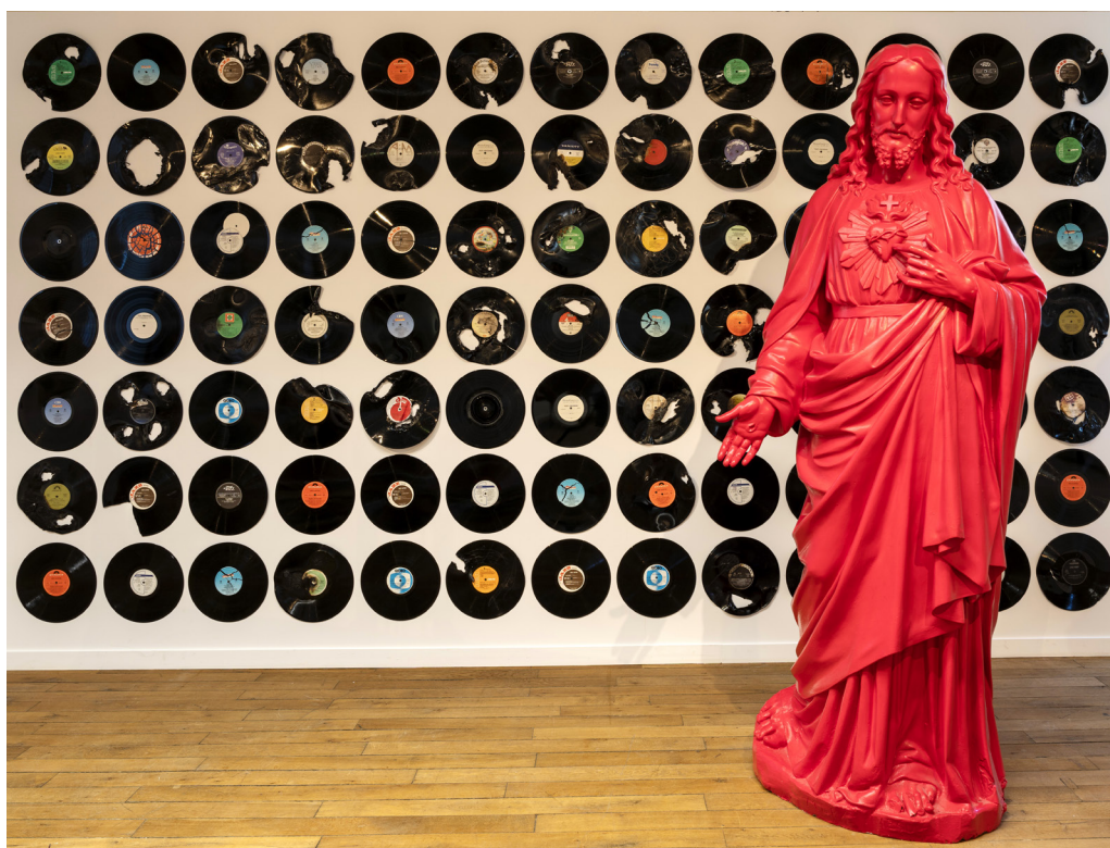
Milan Knížák, sans titre, 1990, Collection Gino Di Maggio

Installée aux côtés du Conservatoire et de l'École d'art de Blois/ Agglopolys dans les murs d'un ancien couvent (17 e -18 e s.) converti en diverses institutions d'enseignement