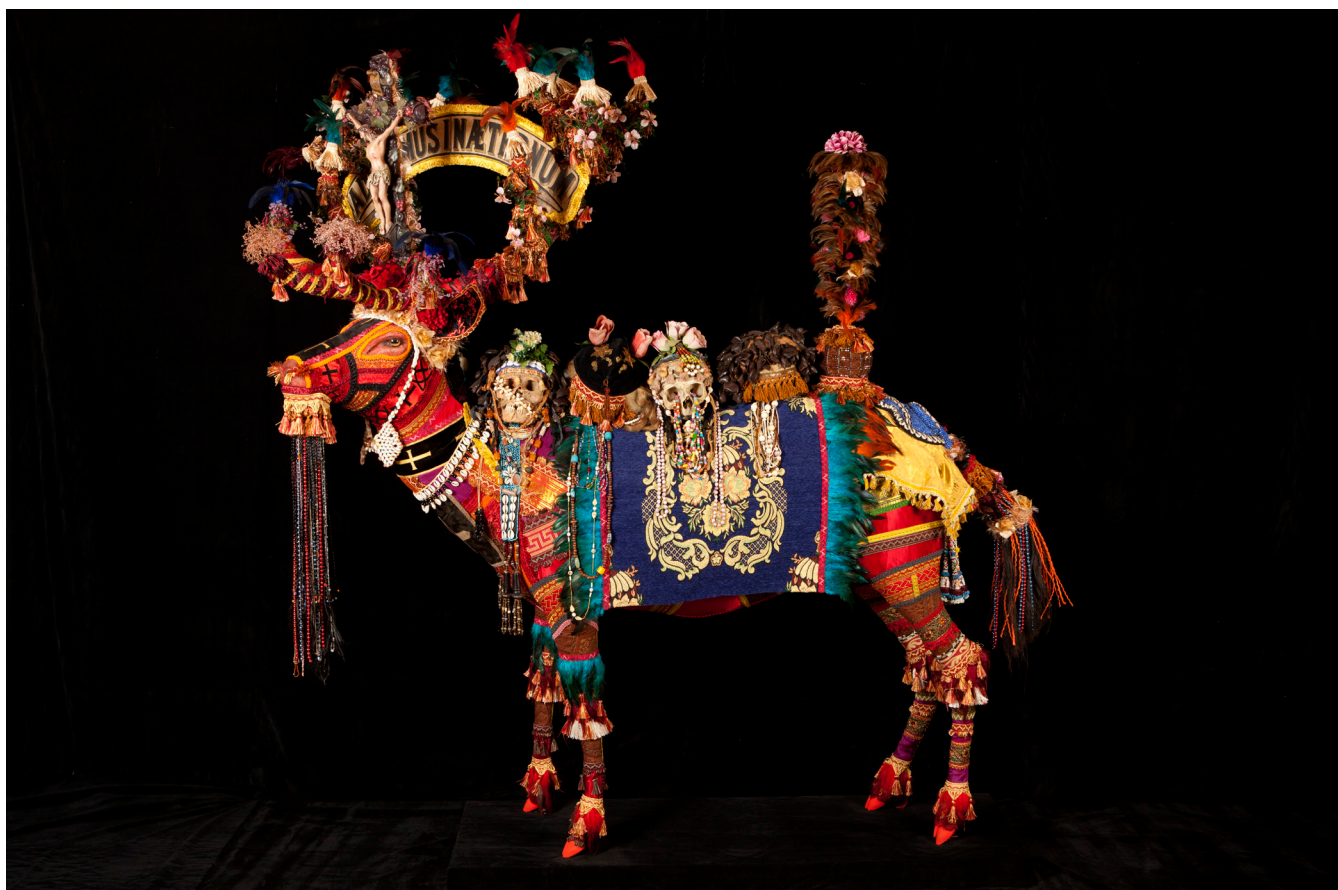
Benoit Huot, Cerf de Saint-Hubert , 2012 - Technique mixte - 150 x 160 x 80 cm Collection privée © Benoit Huot, Gray, 2024