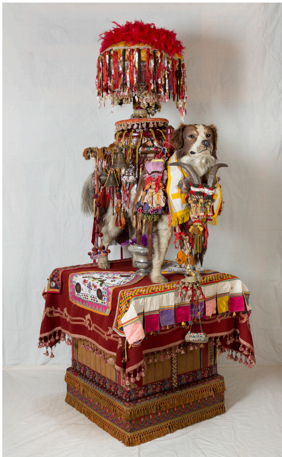
Benoit Huot, Chien , 2013 Technique mixte - 235 x 130 x 75 cm Courtesy de l'artiste © Benoit Huot, Gray, 2024 - Photo : Yves Petit