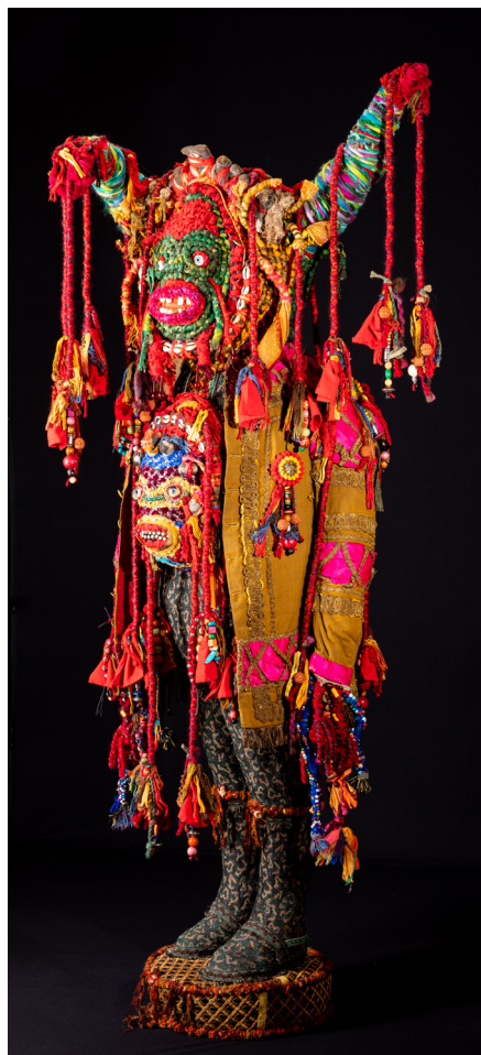
Benoit Huot, Guru , 2019 Technique mixte - 180 x 70 x 80 cm Courtesy de l'artiste © Benoit Huot, Gray, 2024 - Photo : Yves Petit