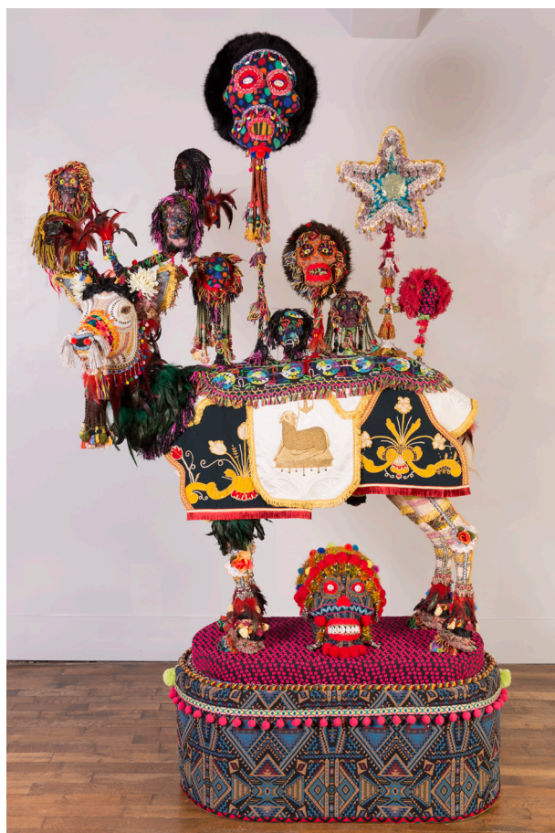
Benoit Huot, Atoum , 2023 Technique mixte - 125 x 175 x 50 cm Courtesy de l'artiste © Benoit Huot, Gray, 2024 - Photo : Yves Petit