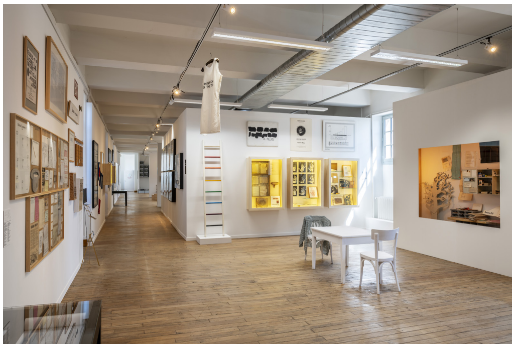
Fondation du doute, exposition permanente (vue générale)

Durant près de vingt ans, ces artistes travailleront, souvent avec un certain sens de l'humour et de la provocation, à abolir toute frontière entre l'art et la vie.