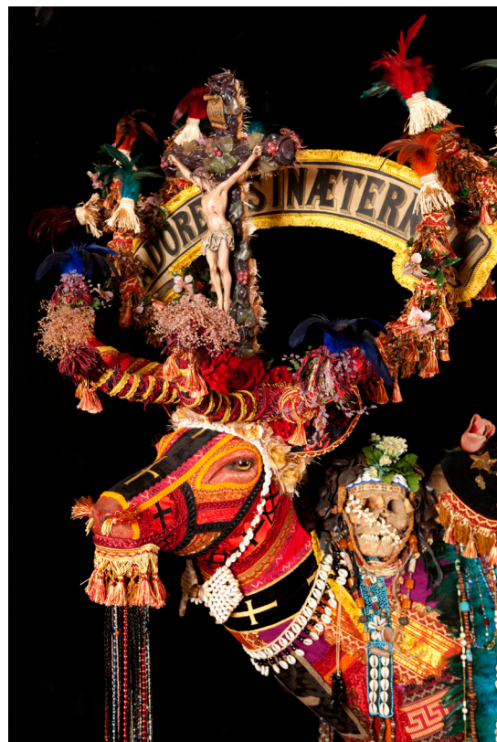
Benoit Huot, Cerf de Saint-Hubert , 2012 Technique mixte - 150 x 160 x 80 cm Collection privée © Benoit Huot, Gray, 2024 - Photo : Yves Petit