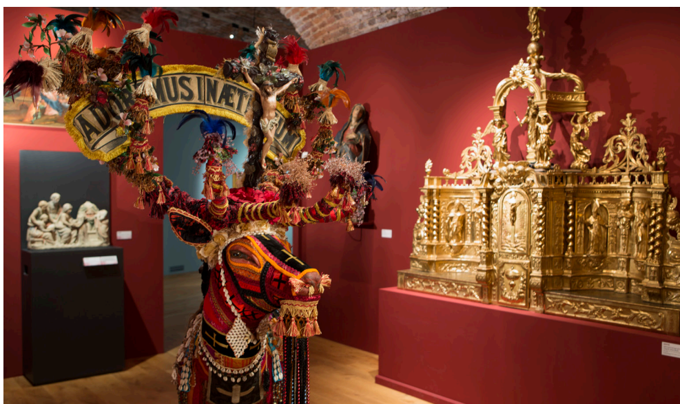
« Bêtes et Dieux, cortèges sacrés », Musée des Beaux-arts, Belfort, 2013

De fils et de fibres | Centre d'Art Contemporain | Mey-