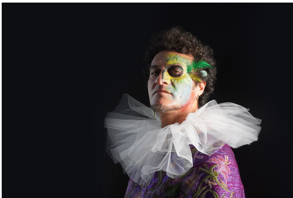
Phantasia, grande parade pour oiseaux de nuit Soirée de réouverture de la Fondation du doute 10 février 2024 au Café Le Fluxus

Tout au long de l'année, un programme transdisciplinaire d'événements (performances, concerts, rencontres, discussions) offre de nouvelles perspectives artistiques, mais aussi historiques, philosophiques... en lien avec les expositions permanentes ou temporaires, mais également avec de nombreux partenaires culturels.