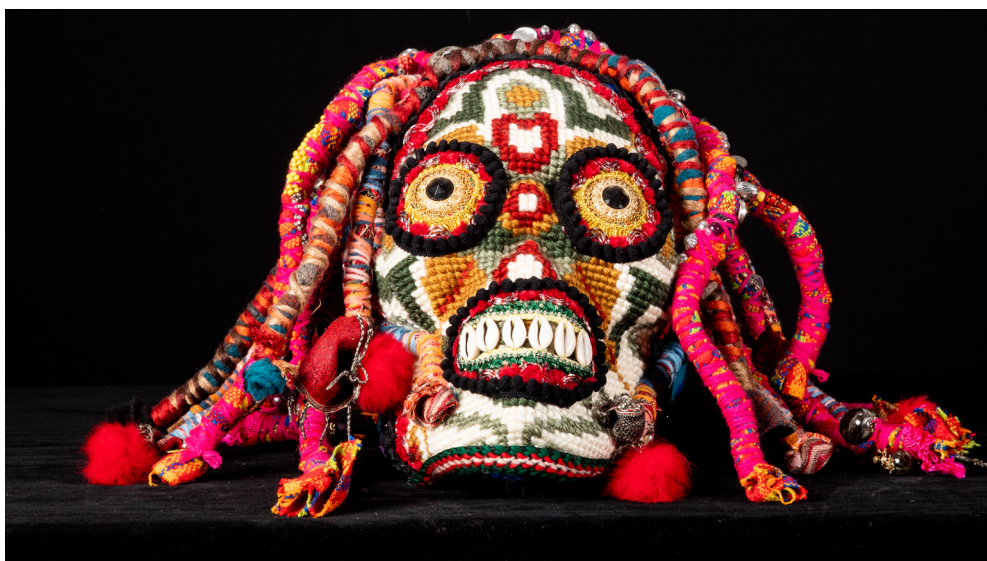
Benoit Huot, Crâne , 2020 Technique mixte - 30 x 50 x 40 cm Courtesy de l'artiste © Benoit Huot, Gray, 2024 - Photo : Yves Petit

Parcours d'œuvres dans les vi- trines de la ville