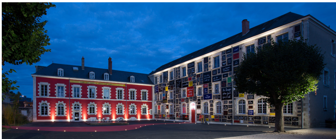
Fondation du doute (Cour du doute), vue de nuit

des projets artistiques avec des partenaires sur l'ensemble du territoire.