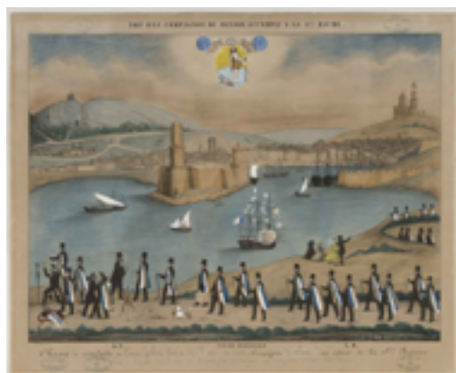
Conduite de maréchaux-ferrants (Sans titre)

Mathelin (Lithographe à Lyon), Maillet (éditeur) Vers 1850 - 1860 / Lithographie colorisée