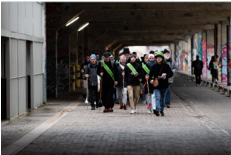
Conduite à Paris, janvier 2024