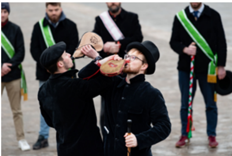
Conduite à Paris, janvier 2024