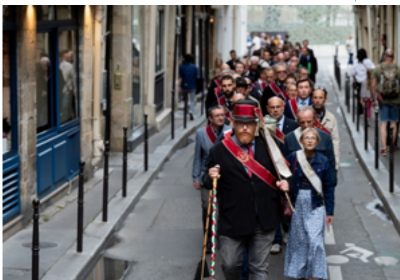
Conduite à Paris, juillet 2023