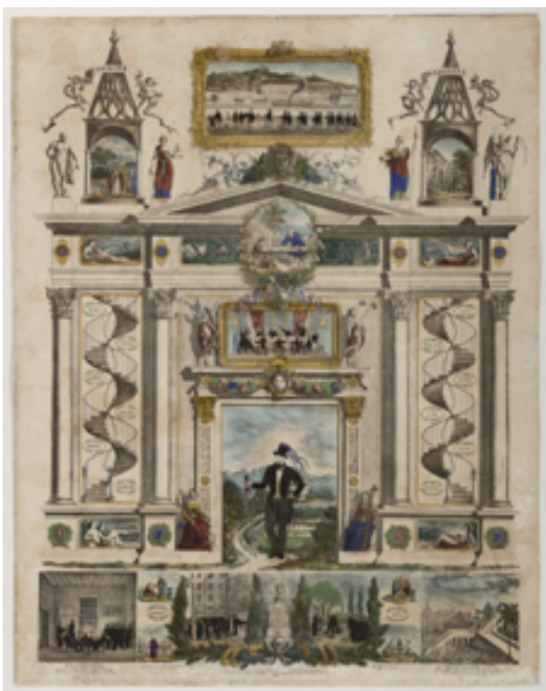
Souvenir du Tour de France (Sans titre)

Boehm et fils (lithographe à Montpellier), BERNARD (imprimeur) 1860 / Lithographie colorisée