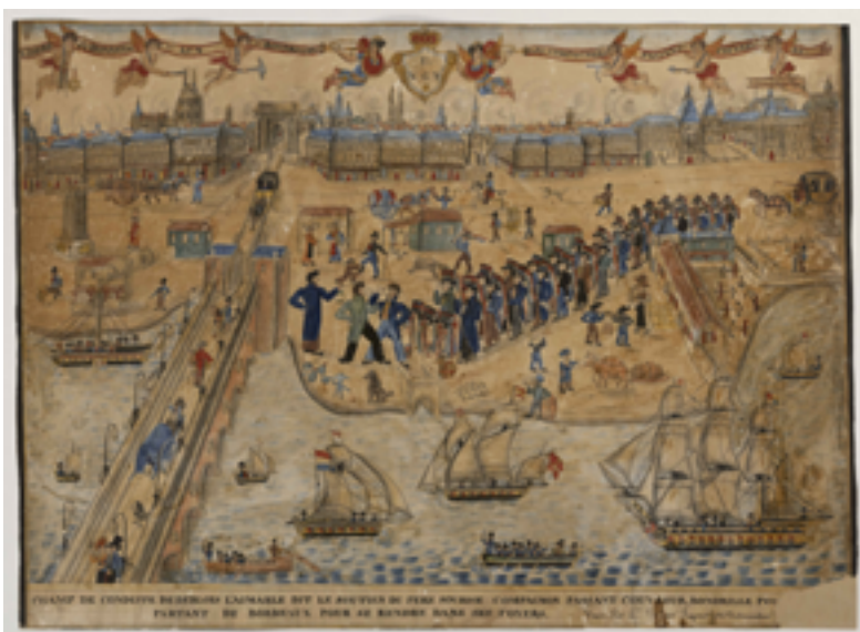
Champ de conduite de Étienne LECLAIR, dit Blois l'Aimable