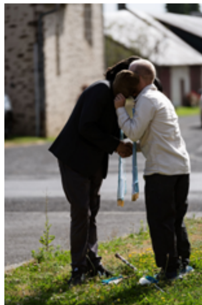
Conduite à Limoges, juillet 2023