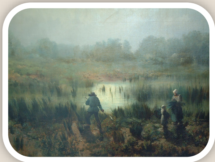
Les Muids, effet du matin en Sologne, vue prise sur les propriétés de l'empereur, Francis Blin

Les élèves découvriront deux tableaux présentant deux visions opposées de la Sologne au 19 e siècle. En demi-classe, ils étudieront une œuvre de Raymond Esbrat ou une œuvre de Francis Blin. Puis, ils devront la présenter à leurs camarades.